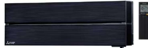
Onyx Black: MSZ-LN25/35/50/60VGB