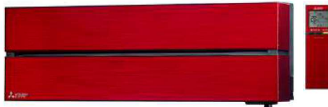
Ruby Red: MSZ-LN25/35/50/60VGR