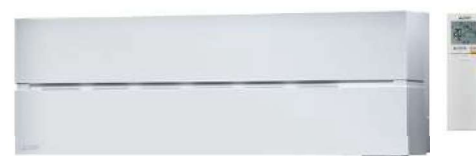
Natural White: MSZ-LN25/35/50/60VGW