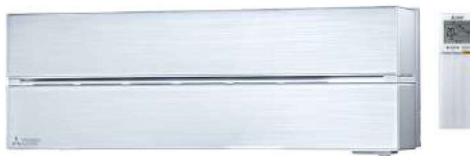
Pearl White: MSZ-LN25/35/50/60VGV